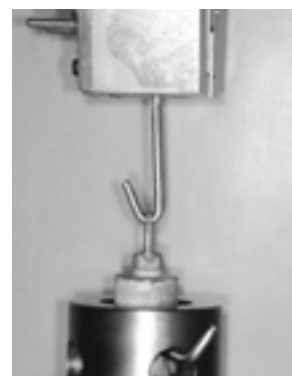
FIGURA 3 – Teste de tração.