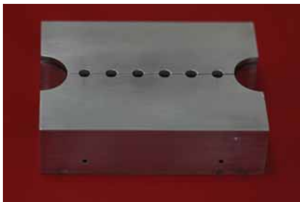
FIGURA 1- Matriz de aço inoxidável

Foi empregada uma matriz bipartida de aço inoxidável com seis cavidades de 5mm de diâmetro por 2mm de profundidade, para a confecção das amostras (Figura 1).