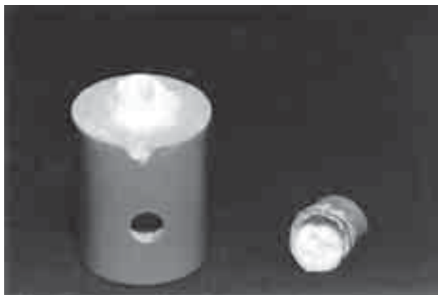
FIGURA 5 - Corpo-de-prova apresentando falha coesiva na dentina.

A: adesiva cimento-preparo; C: coesiva (dentina); M: mista (adesiva e coesiva no cimento).