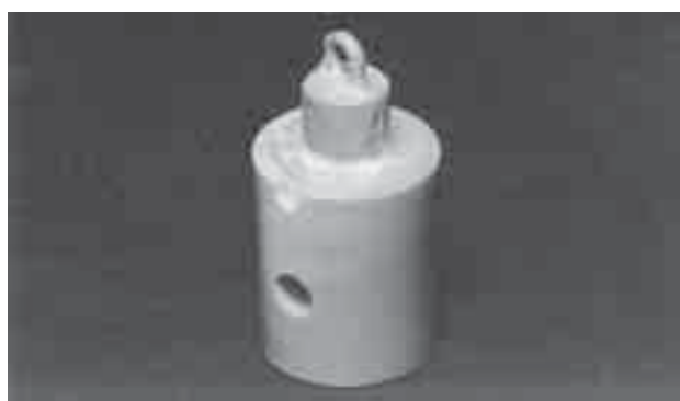
FIGURA 2 - Coroa metálica fundida adaptada ao preparo.