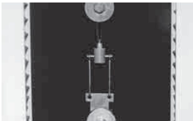
FIGURA 3 - Ensaio de remoção por tração.