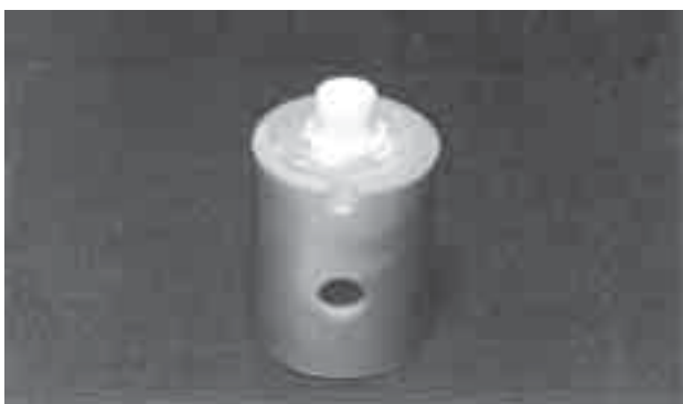
FIGURA 1 - Dente preparado para coroa total.

Os ensaios de remoção, por tração, foram realizados em máquina de testes (Instron – 4411) (Figura 3), com velocidade de 1 mm/minuto, até o deslocamento das coroas, sendo os valores registrados em quilograma-força (kgf). As partes internas das coroas e as superfícies dos preparos foram avaliadas com lupa estereoscópica (Carl Zeiss), para verificação do tipo de falha.