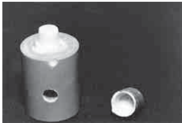
FIGURA 6 - Corpo-de-prova apresentando falha adesiva (cimento-preparo).

O cimento resinoso com adesivo (Cimento de Resina - Scotchbond Multi-Use Plus - 3M) proporcionou a maior resistência retentiva, estatisticamente significativa em relação aos demais (Tabela 2 e Figura 4). Este desempenho, apesar da variação nos valores, está de acordo com pesquisas que observaram melhores resultados para os cimentos resinosos em comparação ao de fosfato de zinco 4,6,29 e com trabalhos que relataram a superioridade dos cimentos resinosos em relação ao de fosfato de zinco e de ionômero de vidro 13,31 .